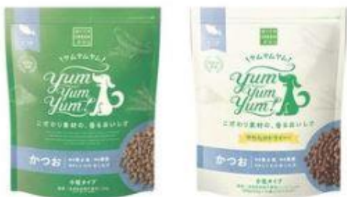
新味・Yum Yum Yum! かつおパッケージ 画像