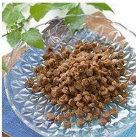
かつおやわらか粒