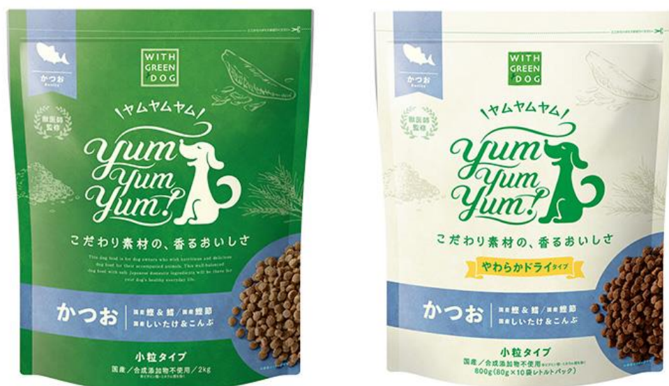
新味・Yum Yum Yum! かつお パッケージ画像